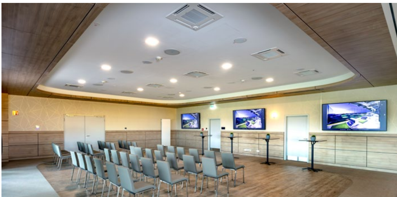
Alle Innengeräte sind mit 3D i-see Sensor-Technologie für eine intelligente Klimatisierung ausgestattet. Der Sensor erkennt die Anwesenheit von Personen im Raum und passt die Temperatur entsprechend an.