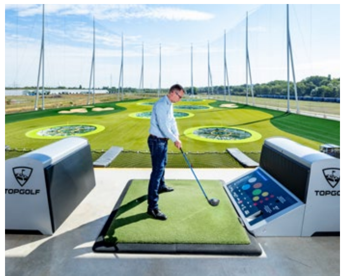
Im Inneren der Golfbälle ist ein Computerchip verbaut, der die Flugdaten beim Abschlag sowie die Flugbahn misst und die erreichte Punktzahl im Ziel den Spielern auf einem Monitor anzeigt.