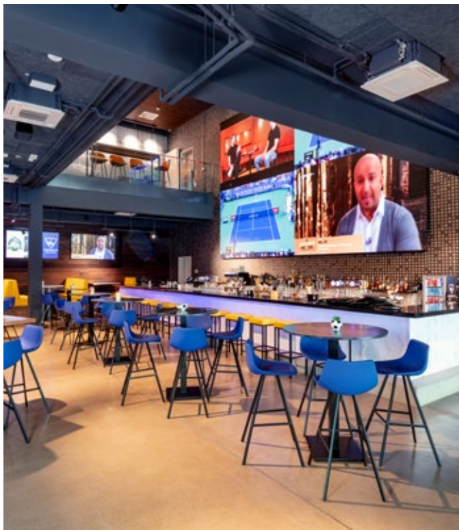
Der horizontale Luftausblas sorgt für eine optimale und für Nutzer nahezu zugluftfreie Durchströmung der zu klimatisierenden Räume mit gekühlter bzw. vorerwärmter, gefilterter Luft.