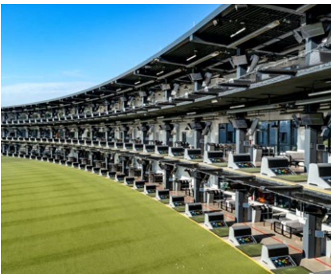
Zu der Freizeitanlage gehören ein dreistöckiges Gebäude mit einem Restaurant und drei Bars, 102 bediente Abschlagplätze, von denen Golfbälle auf ein 200 Meter langes Außenfeld abgeschlagen werden können.

Zu der Freizeitanlage gehören ein dreistöckiges Gebäude mit einem Restaurant und drei Bars, 102 bediente Abschlagplätze, von denen Golfbälle auf ein 200 Meter langes Außenfeld abgeschlagen werden können, sowie eine große Anzahl an Gästeparkplätzen inklusive Ladestationen für E-Fahrzeuge. Auf der Topgolf-Anlage in Oberhausen können Gäste ganzjährig mit Mikrochips ausgestattete Golfbälle abschlagen und mehr als 10 verschiedene Spiele spielen, um so ihr Golfspiel zu üben und zu verbessern. Überhaupt haben es die Golfbälle im wahrsten Sinne des Wortes „in sich“. In ihrem Inneren ist ein Computerchip verbaut, der die Flugdaten beim Abschlag sowie die Flugbahn misst und die erreichte Punktzahl im Ziel den Spielern auf einem Monitor anzeigt.