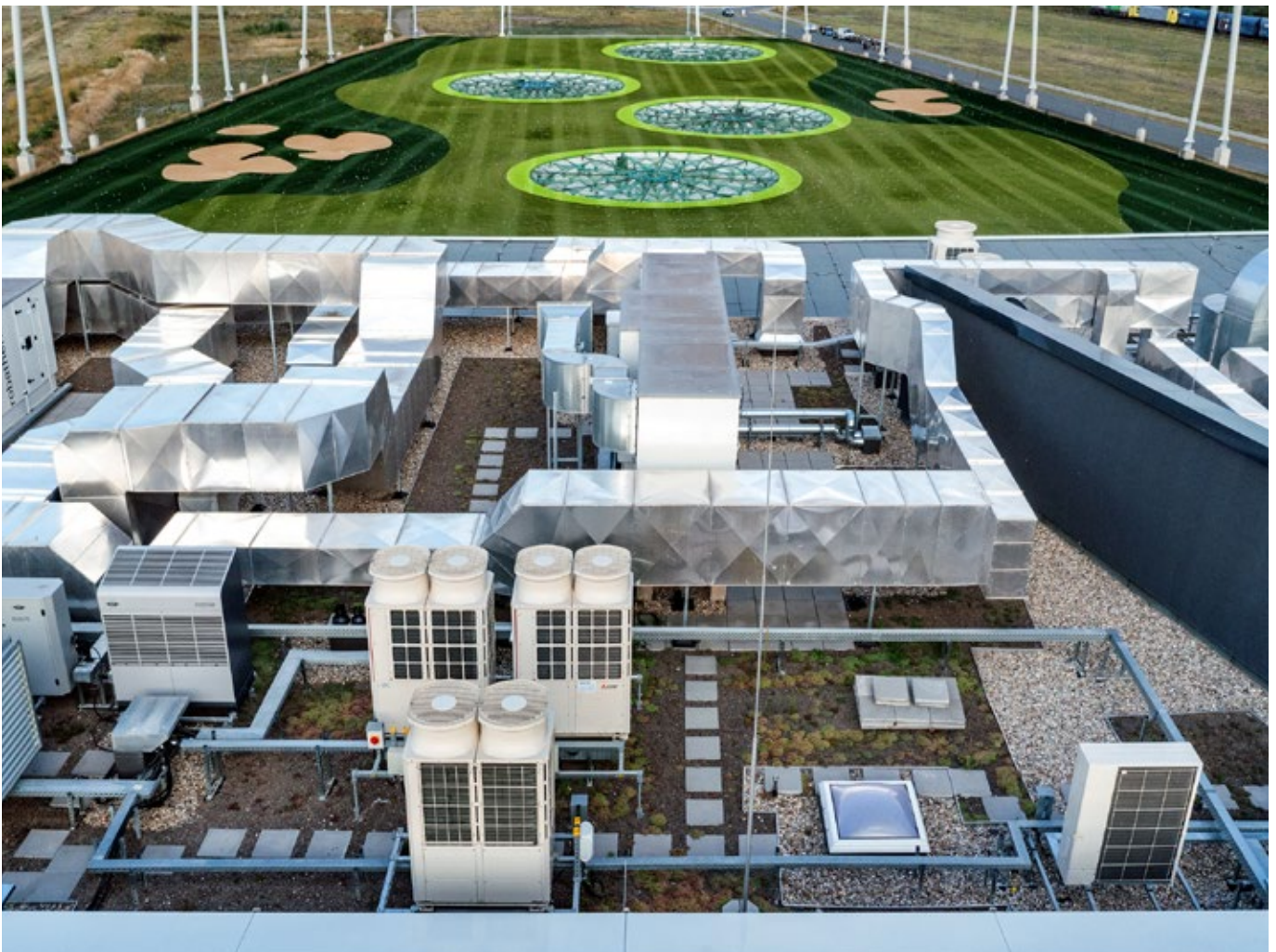
Das eingesetzte City Multi VRF-System der Y-Serie verfügt über eine integrierte Wärmepumpenfunktion und ermöglicht über eine Umschaltfunktion jederzeit wahlweise den Kühl- oder den Heizbetrieb.

Primär dient die Anlage zur Kühlung des Gebäudes. Die Grundlast-Temperaturerregung erfolgt über klassische Heizkörper mittels der hier vor Ort vorhandenen Fernwärme. Darüber hinaus entstehen manchmal kurzfristige Spitzenlasten, für die dann die Klimaanlage zum Heizen genutzt werden kann. So unterstützt die Klimaanlage in der Übergangszeit und in den Wintermonaten die statische Heizungsanlage. Dies ist möglich, da das eingesetzte VRF-System über eine integrierte Wärmepumpenfunktion verfügt und über eine Umschaltfunktion jederzeit wahlweise den Kühl- oder den Heizbetrieb ermöglicht. Darüber hinaus erforderte die Architektur des Gebäudes eine hohe Flexibilität bei der Leitungsauslegung. Infrage kam also nur ein System, mit dem sich lange Rohrleitungen zwischen den Außen- und den Innengeräten realisieren lassen.