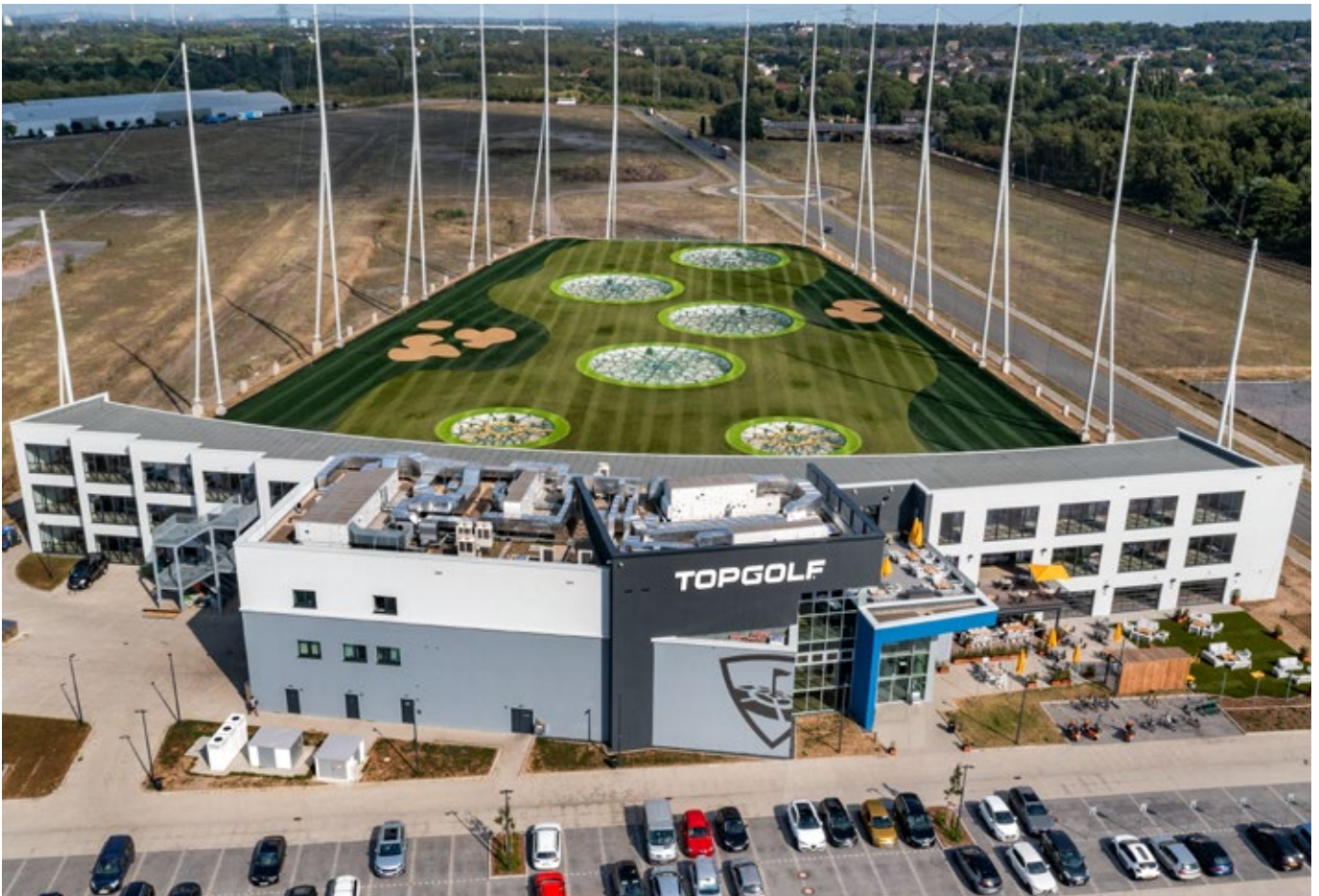
Topgolf ist eine Freizeit-Eventlocation für den Golf-Sport und befindet sich auf einem ehemaligen 30.000 m 2 großen Stahlwerksgelände in Oberhausen.