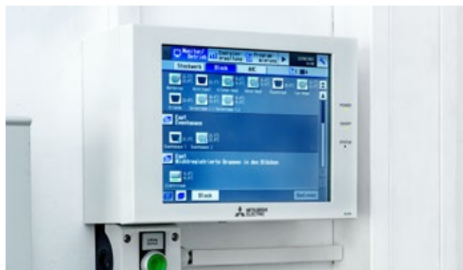
Das Zentralsteuerungssystem vom Typ AE200 bietet die Möglichkeit des Fernzugriffs via Internet oder Smartphone-App, um beispielsweise den Betriebszustand oder eine eventuelle Fehlerdiagnose auszulesen.

Neben den VRF-Systemen sind hier auch noch drei Power Inverter-Systeme aus der Mr. Slim-Serie für die Technikraumkühlung verbaut worden. Zur ganzjährigen Kühlung hängen zwei große 4-Wege-Deckenkassetten vom Typ PLA-ZM125EA in einem großen Serverraum und werden redundant über die PAR-40MAA betrieben. Eine weitere Anlage besteht aus einem Mr. Slim-Außenmodul und einem Wandgerät vom Typ PKA-M60KAL, das in einem weiteren, kleineren Serverraum montiert wurde. Alle Systeme werden von der AE200 angesteuert und überwacht.