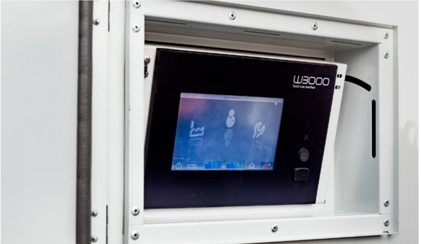
Durch die integrierte Regelungssoftware W3000+ konnte das neue Gerät einfach an die übergeordnete Gebäudeleittechnik angebunden werden.