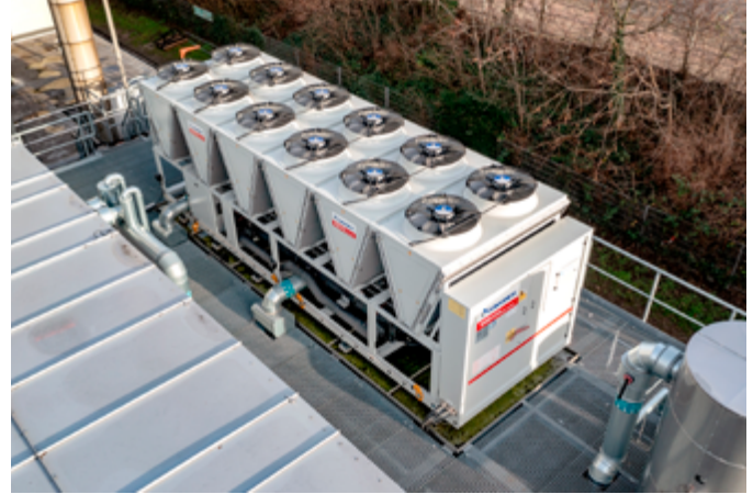
Der neue Kaltwassersatz hat die Aufgabe, die Zuluft von zwei großen Lüftungsanlagen (im Bildvordergrund) zu konditionieren.