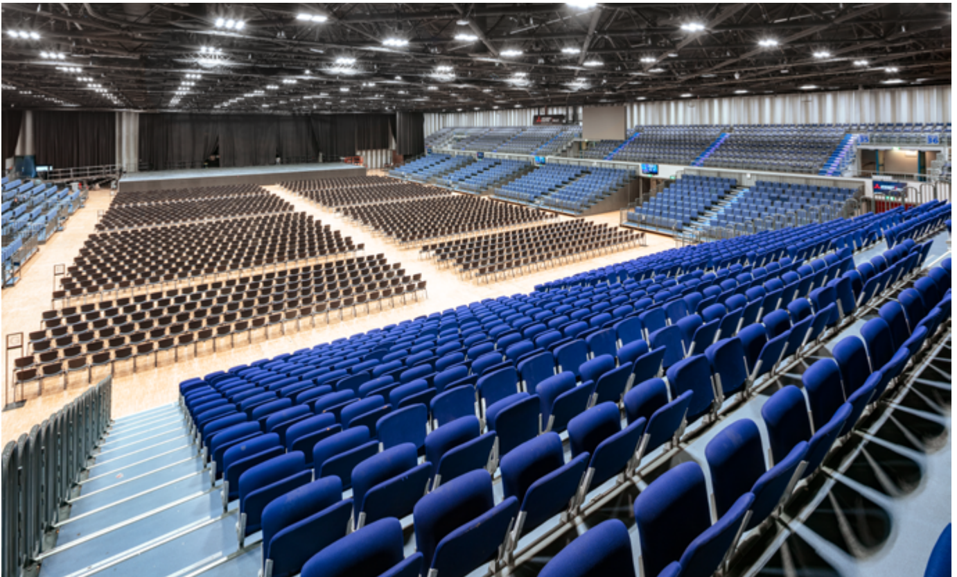
Die Mitsubishi Electric HALLE in Düsseldorf ist eine Multifunktionshalle für Veranstaltungen von bis zu 7.500 Personen.

Vor allem bei voller Auslastung erfordert der Betrieb der Multifunktionshalle eine permanente raumluftechnische Behandlung – sprich Be- und Entlüftung – für die Frischluftversorgung. Für diese Anforderung ist ein besonders hoher und zuverlässiger sowie energiesparender Kühlbedarf erforderlich, um die hohen Wärmelasten in der Veranstaltungshalle abzuführen und den Besuchern ein angenehmes Event-Erlebnis zu bieten. Bei einem Hallenmaß von 9,50 m Höhe, 74 m Länge und 66 m in der Breite ist dies eine Herausforderung, die nur von einem zuverlässigen und effizienten TGA-System erfüllt werden kann.