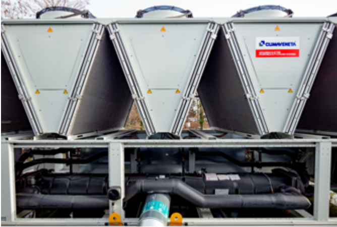
Der neue Kaltwassersatz hat eine Kälteleistung von 836 kW und arbeitet mit dem Kältemittel R454B, das ein sehr niedriges Treibhauspotenzial aufweist.