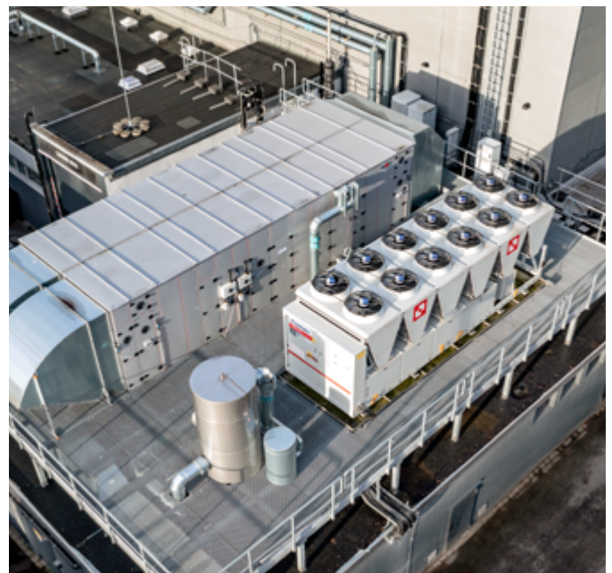
Der neue Kaltwassersatz wurde mithilfe eines großen mobilen Auslegerkrans an die vorgesehene Position auf dem Dach gebracht.

Die neue Gerätegeneration bietet eine höhere Kälteleistung sowie eine gesteigerte Energieeffizienz, mit der ein um bis zu 12 % höherer saisonaler Wirkungsgrad erzielt werden kann. Vor allem der gesteigerte Wirkungsgrad ist ein entscheidender Hebel zur Senkung bzw. Stabilisierung der Energiekosten – und trägt erheblich zu einer schnellen Amortisationszeit bei, da so die Betriebskosten spürbar sinken. Für eine Anwendung in der Komfortklimatisierung spielt neben der zuverlässigen Bereitstellung von Kaltwasser vor allem die Energieeffizienz im mittleren Teillastbereich eine große Rolle. Für die NX2-Reihe wurde deshalb eine neue Generation von Scroll-Verdichtern für den Betrieb mit A2L-Kältemitteln der Fluidgruppe 1 der Druckgeräterichtlinie (DGRL) entwickelt, die im Vergleich zur Vorläuferbaureihe eine deutlich höhere Energieeffizienz besonders im Teillastbetrieb bieten und den Bedingungen der bestmöglichen Energieeffizienzklasse A entsprechen.