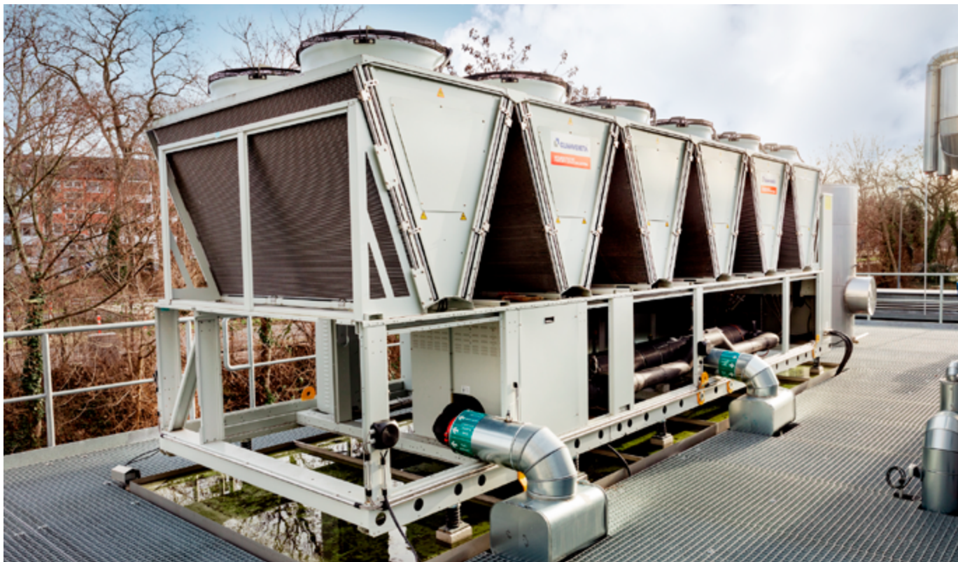
Die stufenlose Regelung der EC-Ventilatoren und der Einsatz drehzahl geregelter Pumpen sorgen zusätzlich für einen geringeren Energiebedarf.