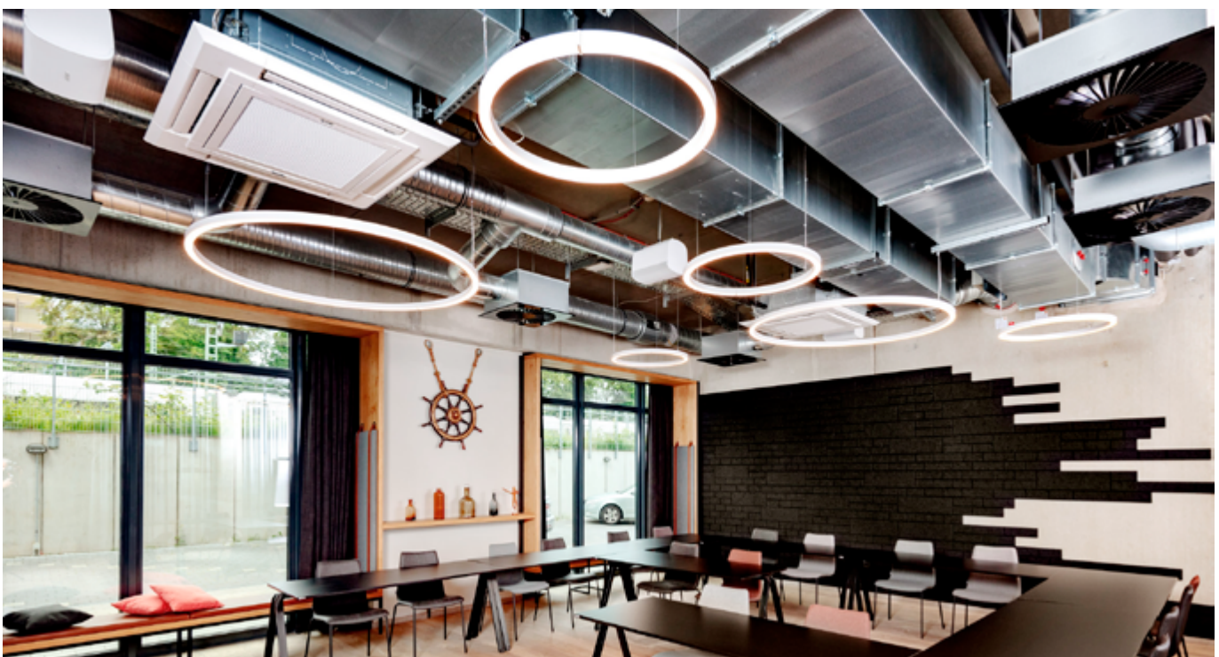
Im Erdgeschoss werden alle Bereiche mit Publikumsverkehr mit Kanaleinbaugeräten in offener Sichtmontage klimatisiert.