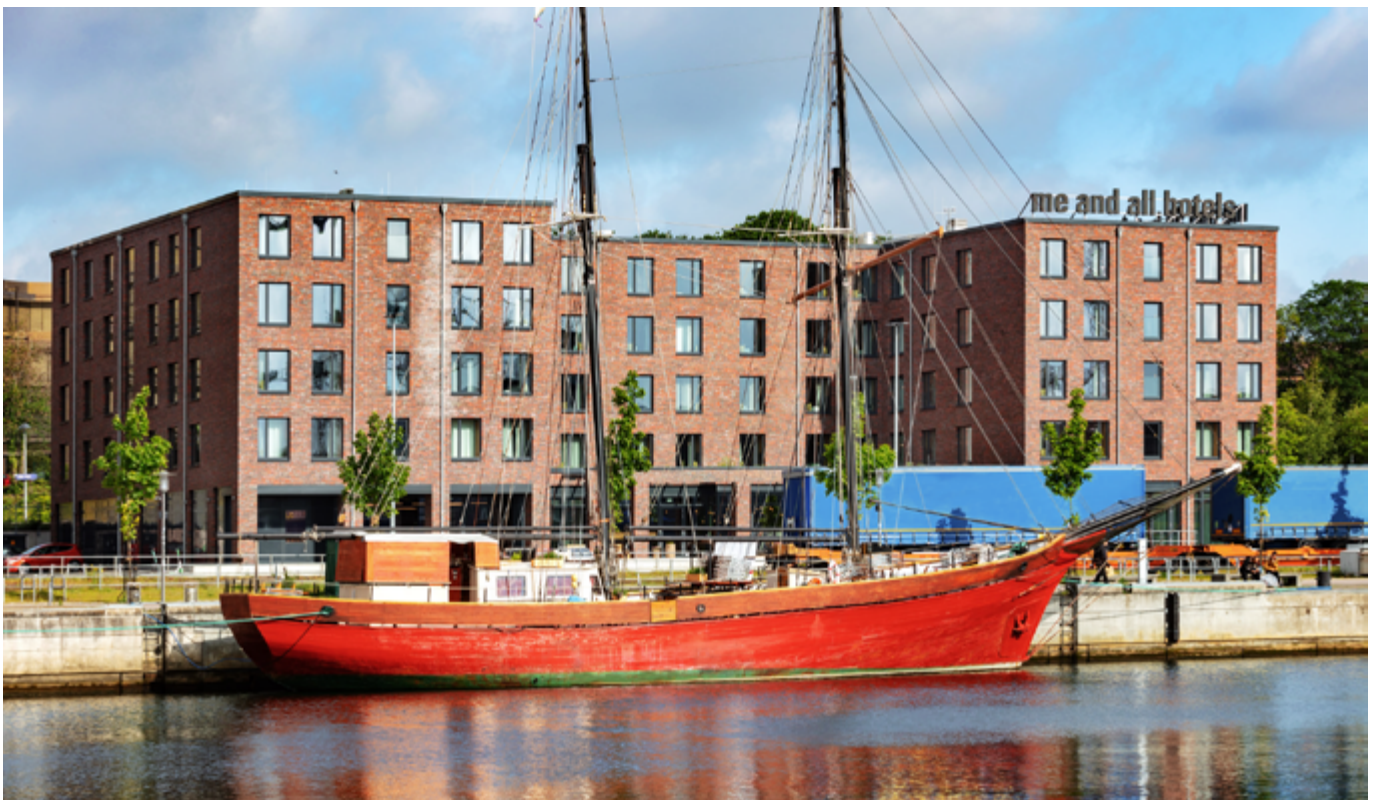
In zentraler Lage nur rund 350 Meter vom Hauptbahnhof entfernt liegt das me and all Hotel Kiel direkt am historischen Hafenbecken mit Blick auf die Kieler Förde.

Die GreenSign-Kriterien sind umfassend und decken sieben Kernbereiche für nachhaltiges Wirtschaften ab: Management und Kommunikation, Umwelt, Einkauf, Regionalität und Mobilität, Qualitätsmanagement und nachhaltige Entwicklung sowie soziale und wirtschaftliche Verantwortung. Eine zentrale Rolle nehmen hierbei die Themen Nachhaltigkeit, Energieeffizienz und Umweltschutz ein. So trägt beispielsweise ein intelligentes Hotelroom-Managementsystem maßgeblich zur Verringerung des Energieverbrauchs von allein rund 25 % bei. Wie aber sehen die Struktur der Gebäudeenergietechnik im me and all Hotel Kiel und hier insbesondere die Klima- und Heizanlagentechnologie aus? Und welche Vorgaben des Bauherrn waren zu beachten?