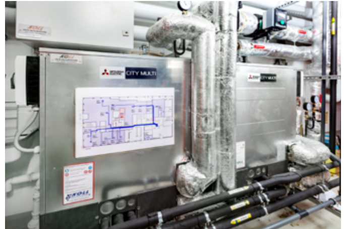
Um die überschüssige Wärmeenergie für die Brauchwassererwärmung zu nutzen, kommen wassergeführte Hybrid VRF-Außengeräten der PQRV-Baureihe zur Innenaufstellung zum Einsatz.