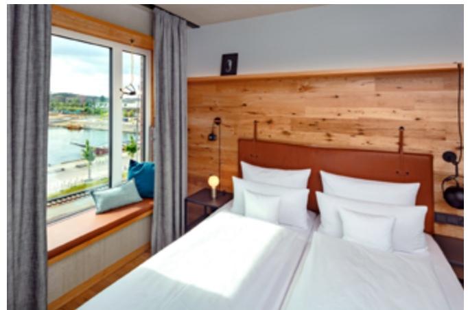
Alle 164 Hotelzimmer werden ausschließlich über das Hybrid VRF-System geheizt oder gekühlt.