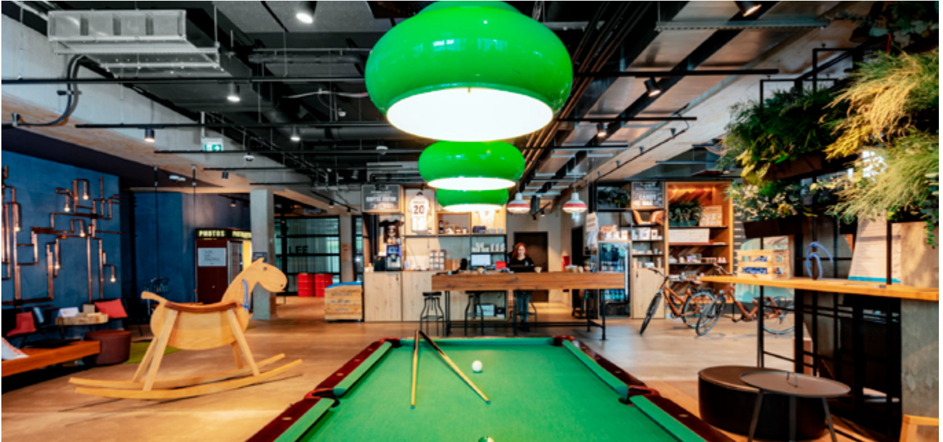
Das Lindner me and all Hotel Kiel überzeugt nicht nur durch seinen stylischen Auftritt, sondern punktet vor allem durch sein modernes Konzept für eine ausgewogene Work-Life-Balance.