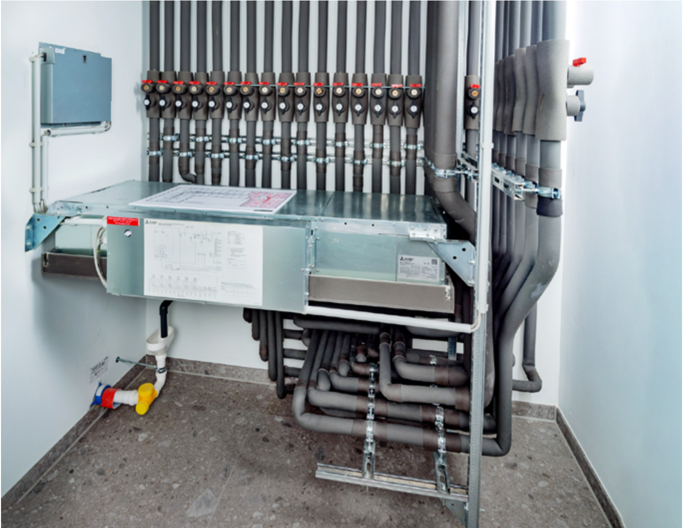
Jeder Außeneinheit ist ein Hybrid BC-Controller (Verteiler) zugeordnet, an den die Klimainnengeräte angeschlossen sind.