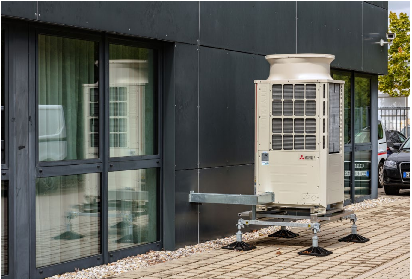
Im Hotel-Kompetenz-Zentrum wird eine voll funktionsfähige luftgekühlte Außeneinheit mit 22,4 kW Kühl- und 25 kW Heizleistung gezeigt.