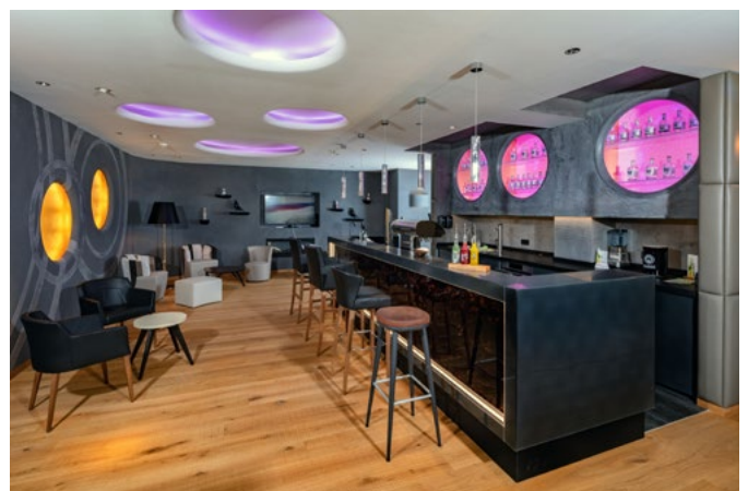
Unter anderem kann auch ein vollausgestatteter Barbereich für den optimalen Hotelbetrieb besichtigt und ausprobiert werden.