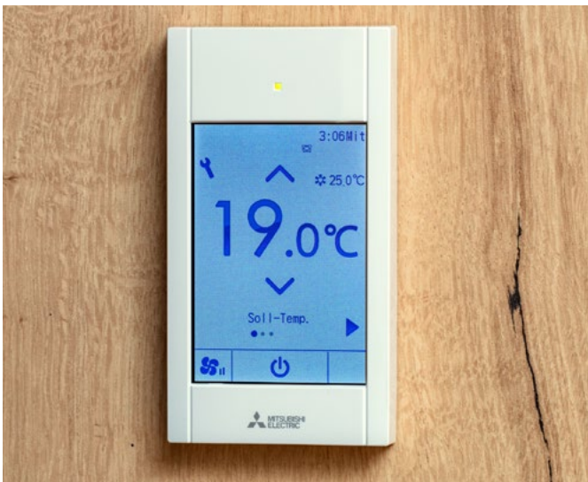
Zur individuellen Steuerung des Raumklimas stehen moderne und individuell konfigurierbare Fernbedienungen zur Verfügung.

Die Daten der Inneneinheiten und der stufenlos arbeitenden Ventile sowie der Außengeräte werden über den M-Net-Bus an die Zentralfernbedienung geleitet. Die Einzelkostenabrechnung kann dann beispielsweise über eine Zentralsteuerung vom Typ AE200 oder das cloudbasierte RMI-Tool realisiert werden.