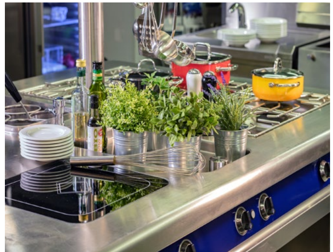
Im Erdgeschoss befindet sich ein Gastro-Kompetenz-Zentrum mit einer voll funktionsbereiten Großküche sowie umfangreichem Zubehör für gelungene Gästebewirtung.

Neben dem Außen- und den Innengeräten sowie dem Hybrid BC-Controller können Interessierte vor Ort auch flexible und zuverlässige Bedienungskonzepte für einen komfortablen Betrieb der Klimasysteme erleben. Der Hersteller Mitsubishi Electric bietet im Bereich der Steuerungssysteme eine Vielzahl an Produkten, von denen die wichtigsten für den Hotelbetrieb im Kompetenz-Zentrum voll funktionstüchtig ausgestellt sind. Grundsätzlich erfolgt die Regelung der Hybrid VRF-Systeme über das hauseigene M-Net. Dies sorgt für den Datenfluss zwischen den Geräten und der Regelung sowie einer optionalen übergeordneten Gebäudeleittechnik. Eine nachträgliche Automatisierung der Anlage ist nicht notwendig. Mit den eingesetzten Ventilen an den Innengeräten können auf Wunsch auch exakte Einzelraumabrechnungen der jeweils benötigten Wärmemenge oder Kühlleistung durchgeführt werden.