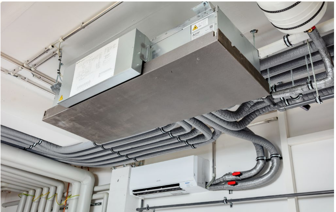
Das Kältemittel zirkuliert nur zwischen dem Außengerät und dem Hybrid BC-Controller (Verteilereinheit), der in einem Technikraum untergebracht ist.