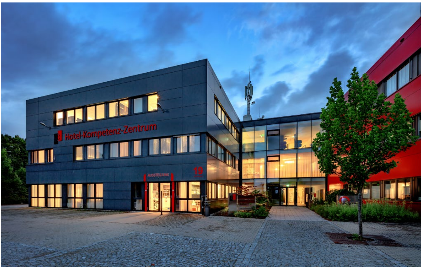
Im Hotel-Kompetenz-Zentrum in Oberschleißheim bei München kann man Möglichkeiten live erleben.