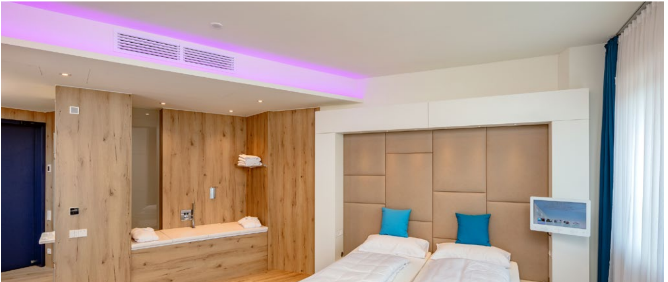
Im Hotel-&-Care-Zimmer, in dem speziell auf das Thema Pflege eingegangen wird, kommt ein Kanaleinbaugerät zum Einsatz.