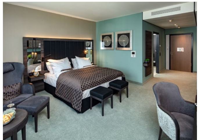
Auf einer Ausstellungsfläche von 3.500 m 2 stehen 13 vollausgestattete Hotelzimmer zum Anschauen und Erleben zur Verfügung.

Sowohl zu Ausstellungszwecken als auch zur Nutzung in den eigenen Büroräumen, im Besprechungszimmer und in einem Technikraum gibt es unterschiedliche Klima-Innengeräte. Insgesamt können dort sieben verschiedene Innengeräte-Modelle in voller Funktion besichtigt werden. Ein Wandgerät im Haustechnikraum führt hauptsächlich überschüssige Wärmeenergie ab. Zwei Deckenkassetten im Eurorastermaß kühlen oder heizen je nach Bedarf jeweils die Büros, eine 4-Wege-Deckenkassette klimatisiert das Besprechungszimmer und in zwei Hotel-&-Care-Zimmern, in denen speziell auf das Thema Pflege eingegangen wird, kommt jeweils ein Kanaleinbaugerät zum Einsatz. In der Präsentations-Lounge von Mitsubishi Electric ist eine 4-Wege-Deckenkassette mit automatisch herabsenkbarem Filterelement installiert.