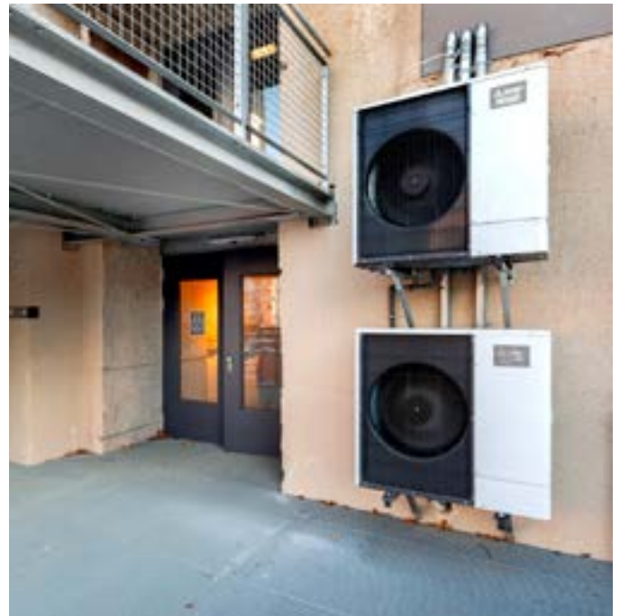
Zwei reversible Ecodan Luft/Wasser-Wärmepumpen von Mitsubishi Electric versorgen als Zweier-Kaskade die neu auf dem Dach des Bunkers entstandenen Wohnungen.

Das heißt, die Wärmepumpen können auch bei sehr niedrigen Außentemperaturen, von bis zu minus 15 °C, noch 100 % ihrer Heizleistung erbringen. Gleichzeitig erweitert sich der untere Einsatzbereich auf bis zu minus 30 °C Außentemperatur, bei dem die Wärmepumpen eine für den Heizbetrieb nutzbare Temperatur zur Verfügung stellen. Ein elektrischer Heizstab oder ein weiterer Wärmeerzeuger ist nicht erforderlich.