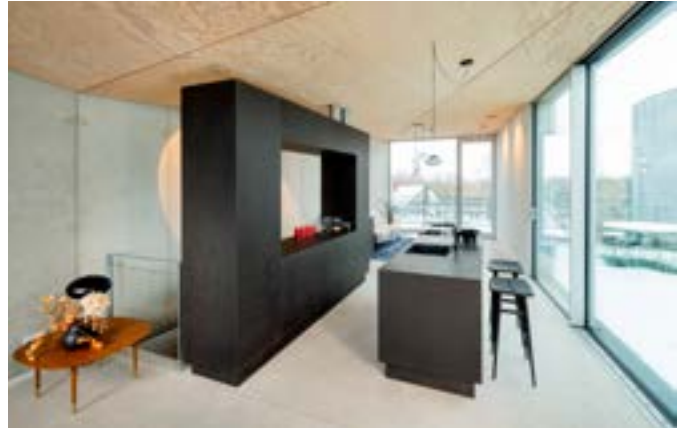
Die hochwertigen Wohnungen haben eine Größe von 97 bis 164 m 2 . Sie werden über Fußbodenheizungen beheizt und können im Sommer über diese auch gekühlt werden.

In einer ersten Phase sind auf dem Dach des Bunkers fünf Maisonette-Wohnungen mit einer kumulierten DIN-Wohnfläche von 670 m 2 errichtet worden. Die sehr hochwertigen Wohnungen wurden als Eigentumswohnungen verkauft und haben eine Größe von 97 bis 164 m 2 . Sie werden über Fußbodenheizungen beheizt und können im Sommer über diese auch gekühlt werden.