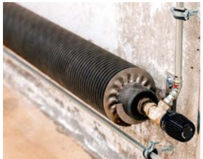
Die Wärmeverteilung übernehmen sogenannte Rippenrohr-Heizkörper, die aufgrund ihrer Rohstahl-Optik gut zum Charakter des Bunkers passen.

Effizienter sind Kaskaden, weil die Geräte in Teillast effizienter laufen. Die Regelung mit Auto-Adaptfunktion optimiert das Betriebsverhalten und sucht automatisch den jeweils besten Betriebspunkt. Außerdem bietet eine Kaskade eine Redundanzfunktion bei der Wartung von Einzelgeräten und führt zu einer erhöhten Betriebssicherheit. Die Vierer-Kaskade aus vier Einzelgeräten vom Typ PUD-SHWM140YAA mit jeweils 14 kW Nennwärmeleistung sorgt für die Wärmeversorgung des alten Luftschutzbunkers. Aufgeteilt in sieben Etagen (zwei Kellergeschosse und fünf oberirdische Ebenen) umfasst die Gesamtfläche ungefähr 2.300 m 2 die durch die Wärmerückgewinnung der zentralen Lüftungsanlage und die vier Luft/Wasser-Wärmepumpen beheizt werden. Damit decken die Wärmepumpen die Heizlast des Gebäudes im monovalenten Betrieb ab. Die Wärmeverteilung übernehmen sogenannte Rippenrohr-Heizkörper, die aufgrund ihrer Rohstahl-Optik gut zum Charakter des Bunkers passen.