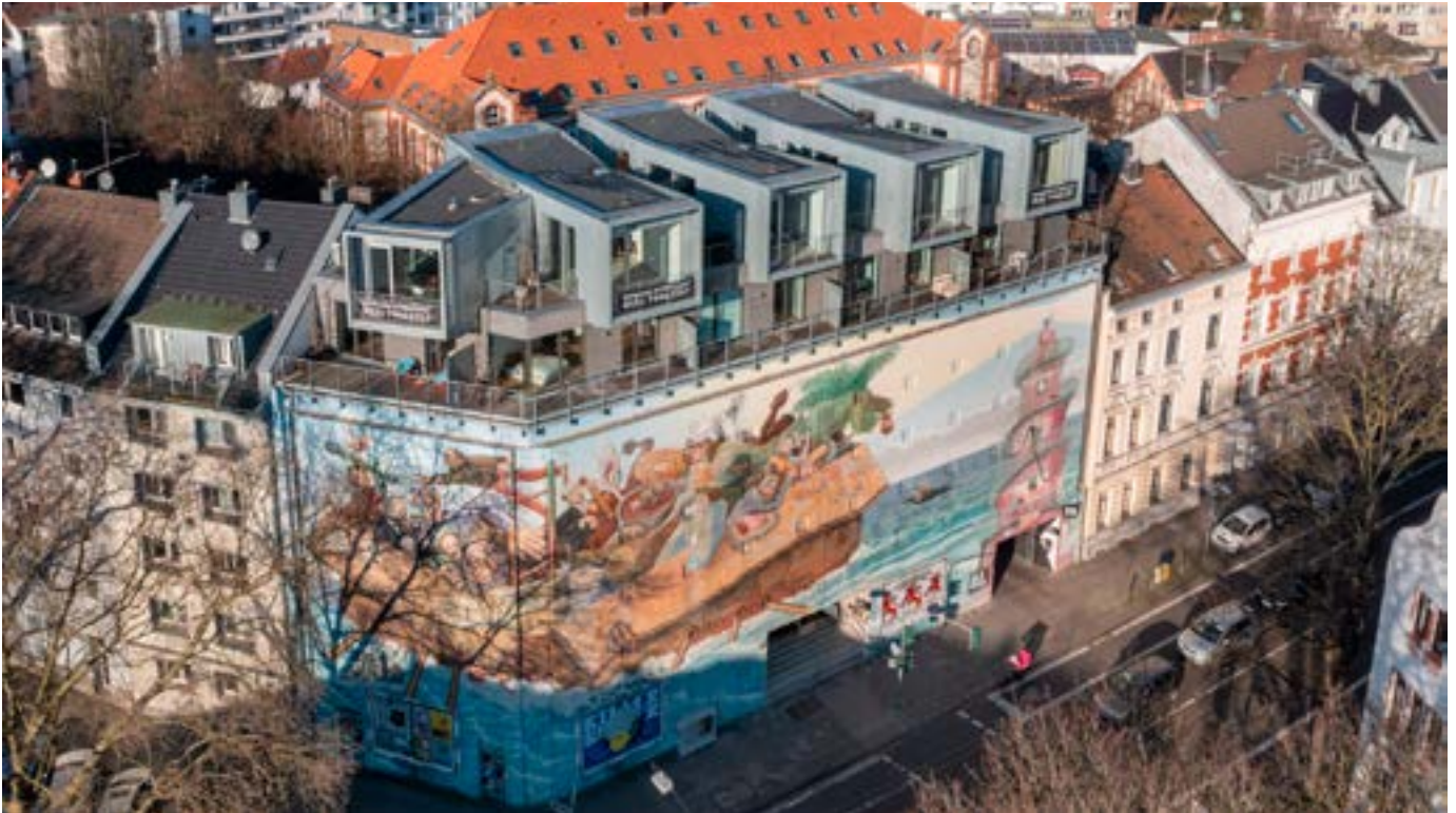
Durch die Umnutzung zum Kunst- und Kulturraum entstand mit dem „Bilker Bunker“ eine gemeinnützige Kulturinstitution. Auf dem Dach des Bunkers sind fünf Maisonette-Wohnungen mit einer kumulierten DIN-Wohnfläche von 670 m 2 errichtet worden.