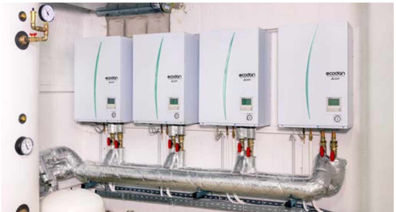
Die Innengeräte für die Vierer-Kaskade, die den Bunker versorgen, befinden sich in einem Technikraum. Zu jeder Außeneinheit gehört ein Hydromodul mit Wärmetauscher-Einheit.