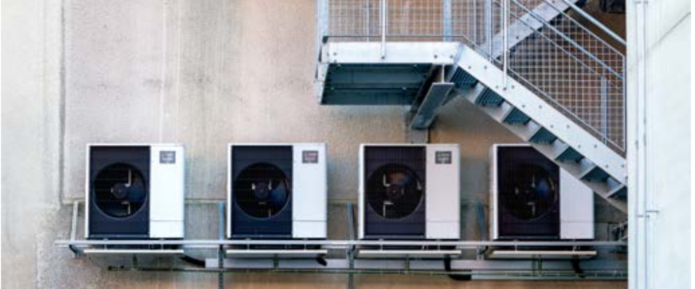
Als Lösung für die Beheizung des Bunkers kommen vier Ecodan Luft/Wasser-Wärmepumpen von Mitsubishi Electric in Kaskaden-Schaltung zum Einsatz.