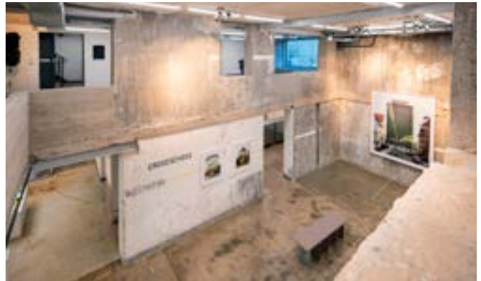
In der zweiten Bauphase wurden vor allem im Innenbereich Wanddurchbrüche geschaffen, um eine gewisse Luftigkeit und Durchlässigkeit zwischen einzelnen Räumen zu erzeugen.

In der zweiten Bauphase wurde der ursprüngliche Baukörper (Bunker) unter Beachtung des Denkmalschutzes umgebaut. Dabei wurden vor allem im Innenbereich Wanddurchbrüche geschaffen, um eine gewisse Luftigkeit und Durchlässigkeit zwischen einzelnen Räumen zu erzeugen. Darüber hinaus wurden teilweise Decken herausgenommen und neue Stahlträger eingezogen, um in Ausstellungsräumen die Möglichkeit zu haben, größere Objekte aufzustellen.