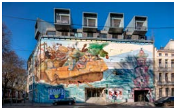
Zahlreiche Bunker aus dem zweiten Weltkrieg prägen das Bild in deutschen Großstädten bis heute.

Eigentümer ist die KÜSSDENFROSCH Häuserwachküsgesellschaft mbH, die interessante, erhaltenswerte und außergewöhnliche Gebäude sucht und kauft sowie das richtige wirtschaftliche Konzept findet, um den Erhalt dieser Gebäude für das Stadtbild und die nächsten Generationen sicherzustellen.