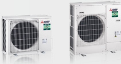
PUZ-ZM35 / 50VKA2