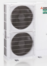
PUZ-ZM200 / 250YKA2